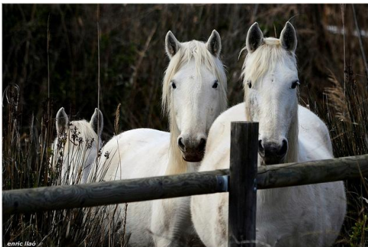
Reserva natural de Sebes