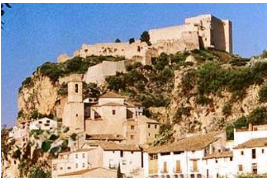
Castell de Miravet