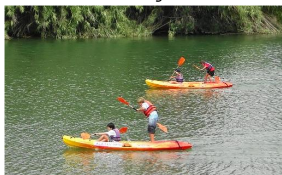
Piraguas y kayacs