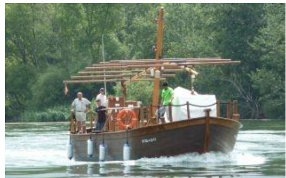
Llaüt Lo Roget