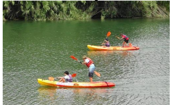
Piragües i Kayacs